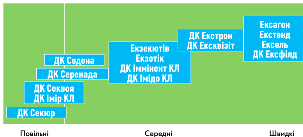
Рис. 6. Темпи розвитку гібридів озимого ріпаку ДЕКАЛЬ в осінній період