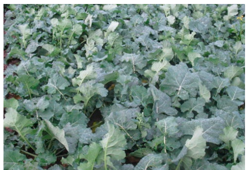
Фото 1. Рівномірний розвиток рослин (гомогенні посіви)

Таким чином, загальна продуктивність посіву є результатом індивідуальної продуктивності різноморфних рослин і буде визначатись оптимальними параметрами стеблостою.