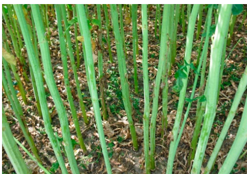
Фото 2. Рівномірний розвиток рослин (гомогенні посіви)

Питання продуктивності озимого ріпаку залежно від густоти стояння рослин є достатньо вивченим і діапазон рекомендованих густот також є лімітованим (3050 шт./м 2 ). Дослідження і виробнича практика показують, що максимально рівні врожайності озимого ріпаку були досягнуті як за низьких (до 25 шт./м 2 ), так і за високих (понад 55 шт./м 2 ) густот рослин. При цьому визначальними факторами є зона вирощування, рівень ресурсного забезпечення (зокрема, удобрення), особливості весняного розвитку, сортові особливості.