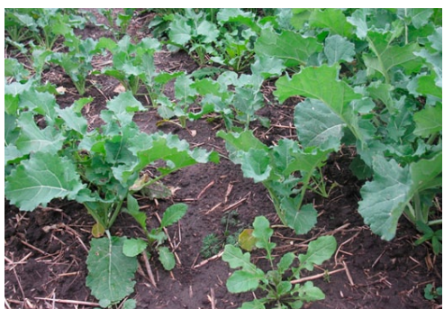
Рис. 3. Нерівномірний розвиток рослин (гетерогенні посіви)

висівати на більшу глибину, що дає можливість відтермінування строків сівби на пізніші (особливо в зоні недостатнього або нестійкого зволоження).